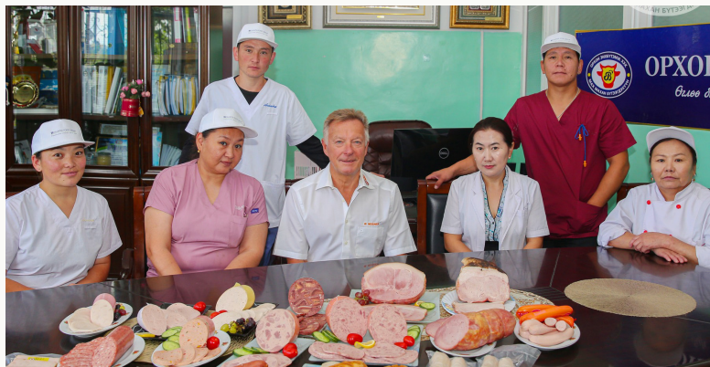
Тус үйлдвэр гадаадын шилдэг технологичийг урьж, бүтээгдэхүүний чанар, үйлдвэрлэлийн процесс болон шинэчилсэн жор дээр хамтарч ажилладаг.

нийцсэн шинэ үйлдвэрийн байраа барьж байгаа юм. Шинэхэн үйлдвэрээ ирэх наймдугаар сард ашиглалтад оруулахаар тэд төлөвлөжээ. ■