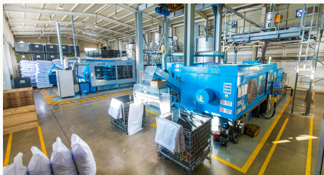
Италийн SIPA брэндийн өндөр хүчин чадлын Xform 250 маркийн хуванцар үйлдвэрлэлийн машин