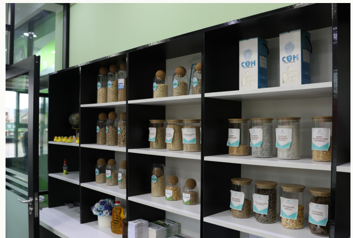
Компанийн бүтээгдэхүүний дээж

▶ тэндээ бүтээгдэхүүнээ тогтмол дээжилж, шинжилж, шинэ бүтээгдэхүүнээ туршдаг ажээ. Харин удирдлагын өрөөнөөс бүтээгдэхүүн үйлдвэрлэлийн явц, бүтээгдэхүүний орц найрлагыг хянаж, хаанаас ямар хэмжээний бүтээгдэхүүн татах шаардлага байгааг хянадаг юм байна.