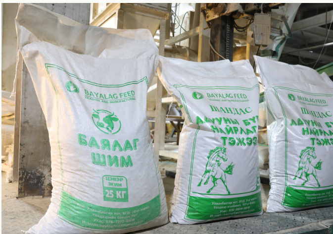
“Баялаг фийд” ХХК-ийн бүтээгдэхүүн